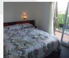
HOTEL LAS VEGAS