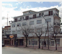
HOTEL LAS VEGAS